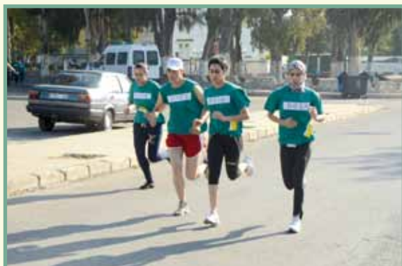
Premier peleton Dames