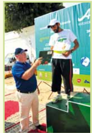
Gagnant goupe D