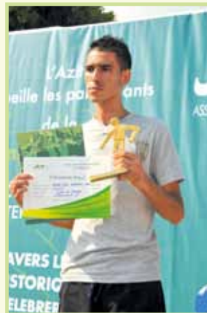
Gagnant goupe C