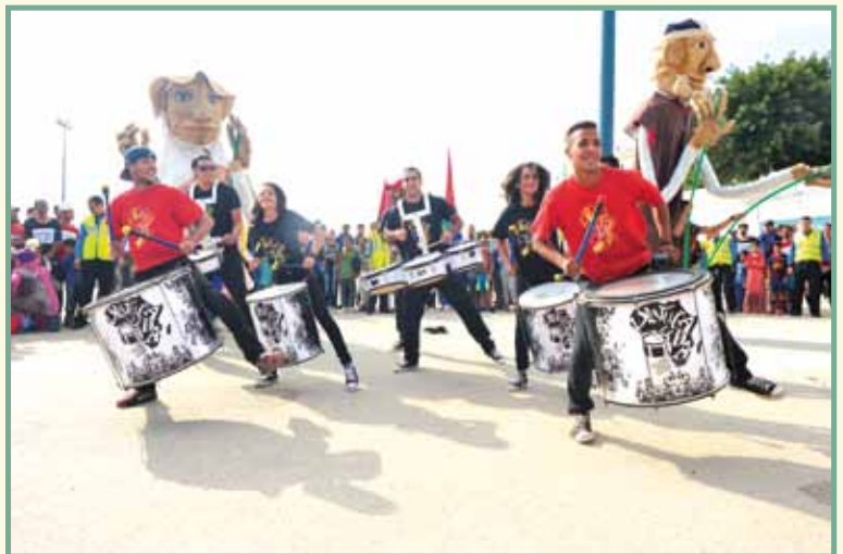
Les rythmes des OVERBOYS