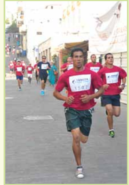
Descente de la rue de la Kasbah