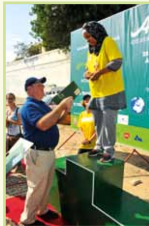
Gagnante goupe B