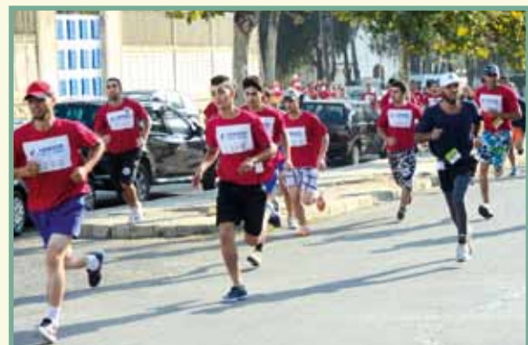
Premier peleton Messieurs