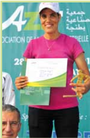
Gagnante goupe A