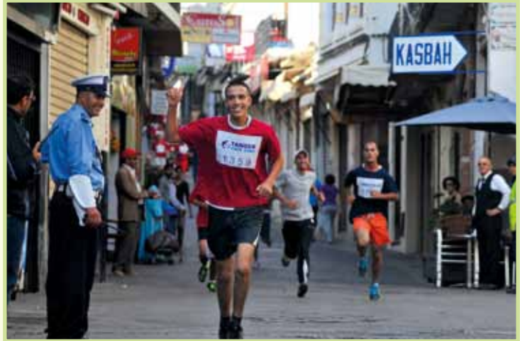
Le salut du coureur au policier