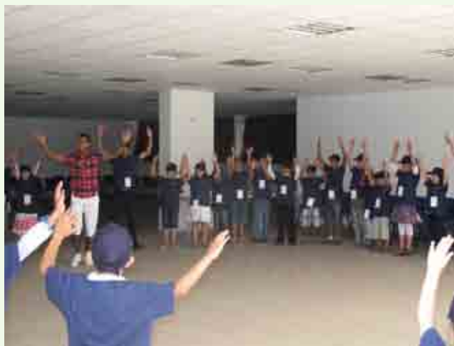
Opération: Matinée enfants

De manière créative et judicieuse d'un point de vue commercial, les employés améliorent l'environnement en s'efforçant de réduire notre empreinte, en encourageant l'enseignement et la sensibilisation, ainsi que l'innovation en termes de produits et de services.