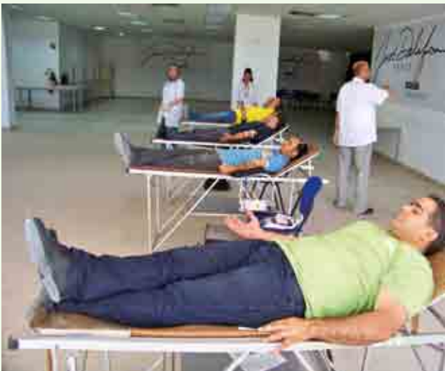
Opération: Don du sang

« Notre tâche n'est pas de sauver le monde entier, mais de nous efforcer de réparer et d'améliorer la partie qui est à notre portée ».