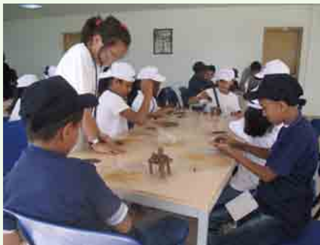
Opération: Apprentissage au modelage