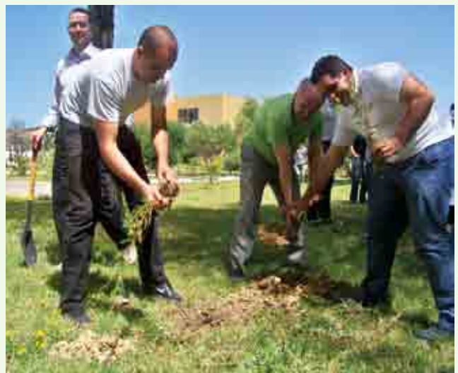
Opération: Nous plantons des arbres